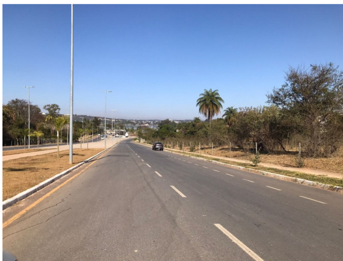
Figura 2 – Imagem referente à via de acesso ao Complexo Poliesportivo.