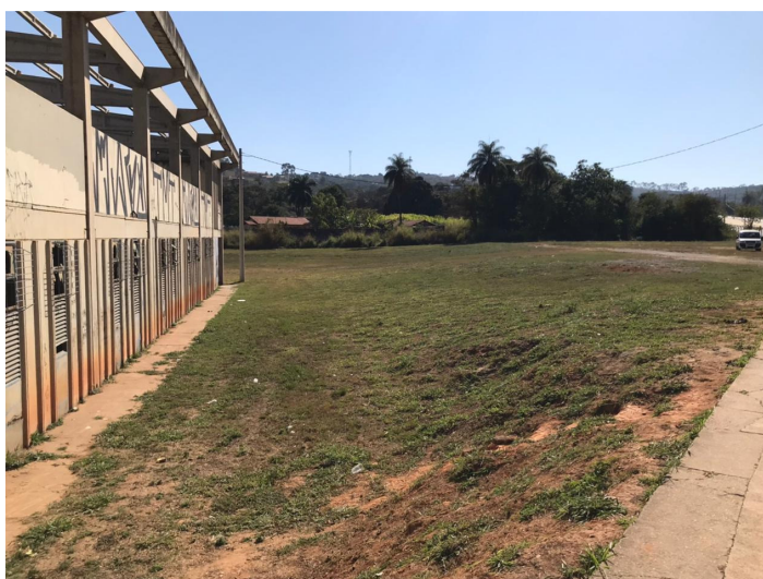
Figura 6 – Área destinada à implantação do Complexo Poliesportivo.