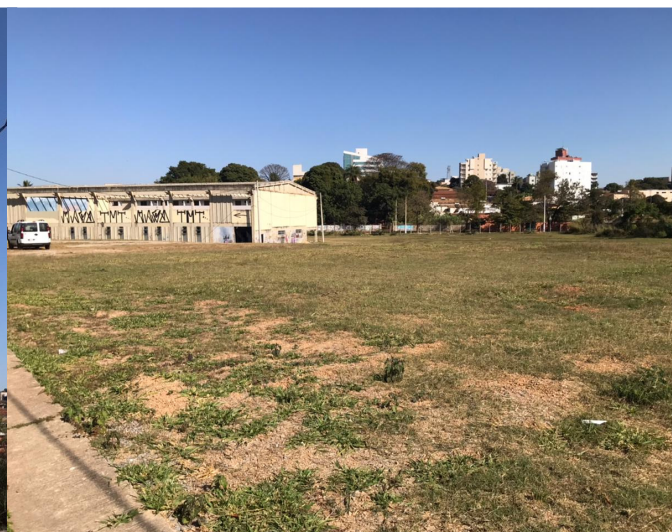
Figura 5 – Área destinada à implantação do Complexo Poliesportivo.