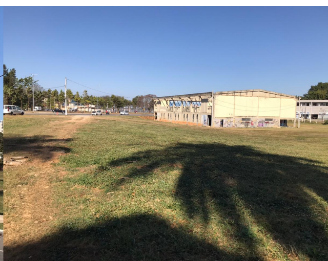
Figura 9 – Área destinada à implantação do Complexo Poliesportivo.