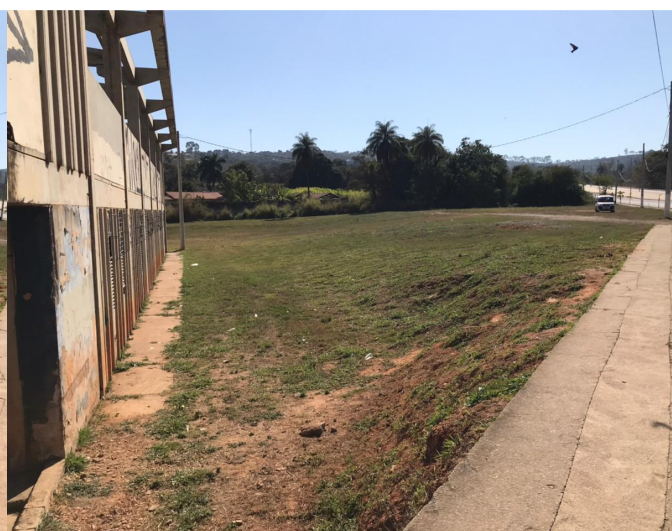
Figura 7 – Área destinada à implantação do Complexo Poliesportivo.