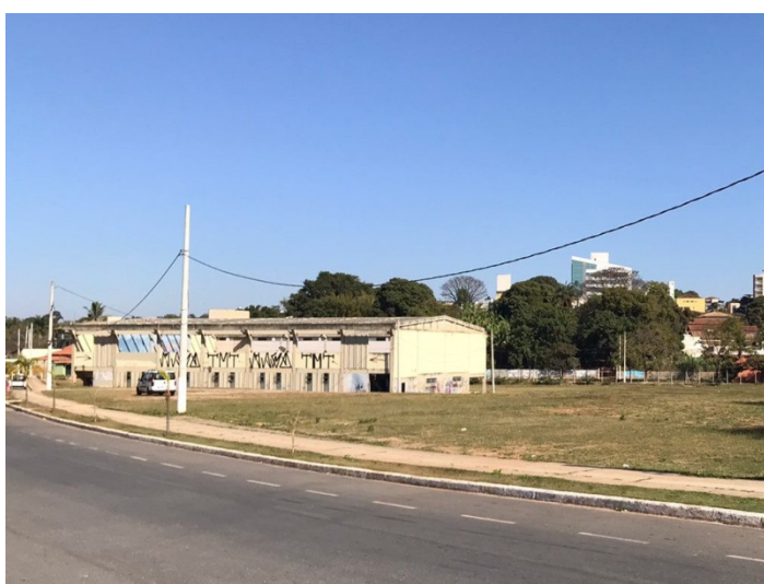
Figura 8 – Área destinada à implantação do Complexo Poliesportivo.