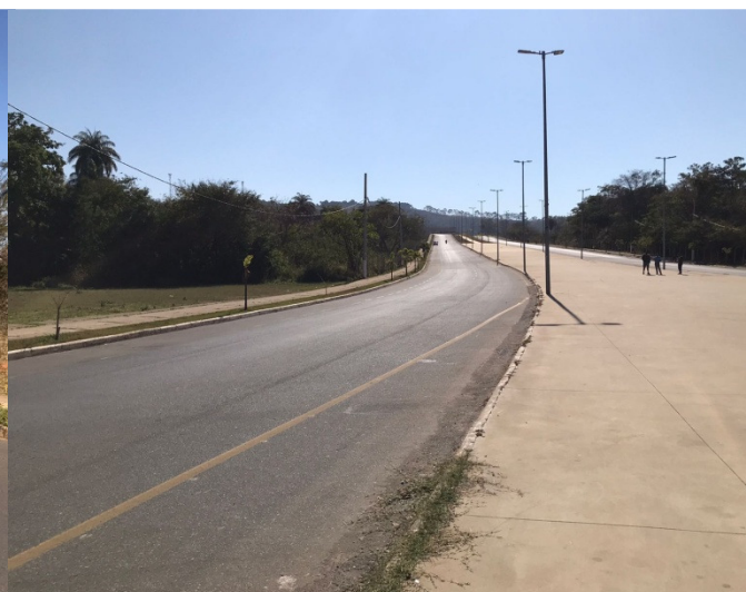
Figura 3 – Imagem referente à via de acesso ao Complexo Poliesportivo.