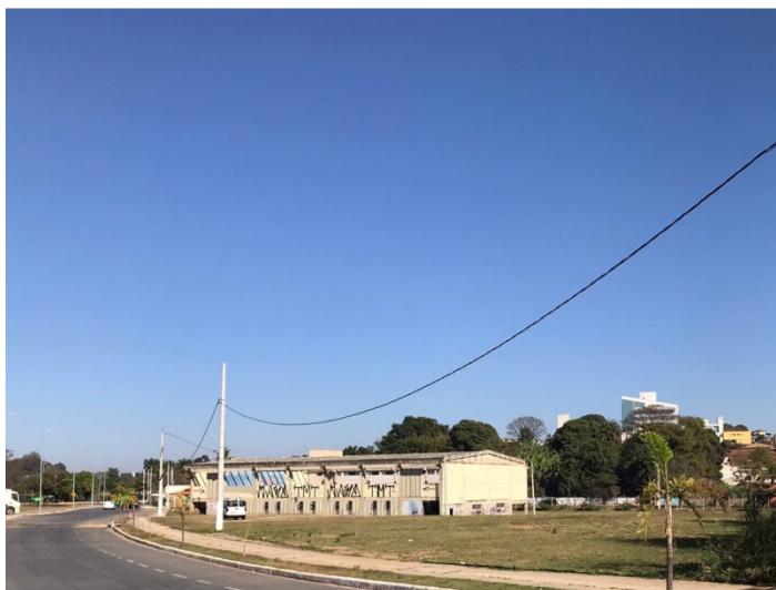
Figura 4 – Área destinada à implantação do Complexo Poliesportivo.