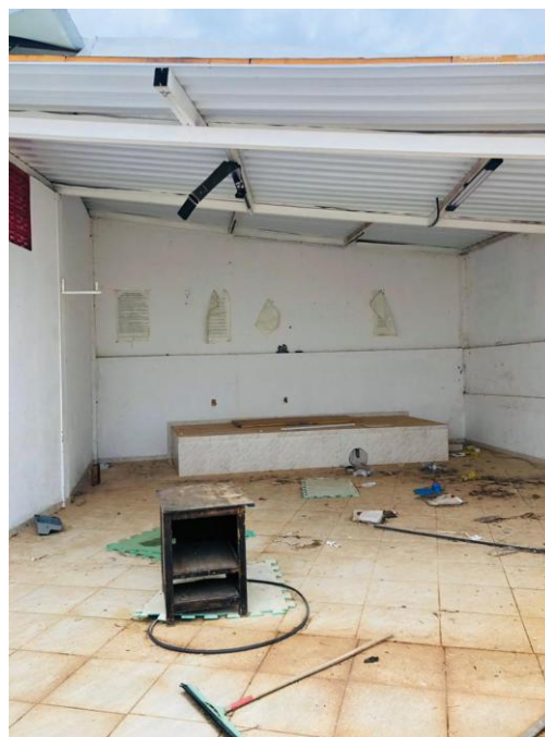
Figura 3 – Interior da edificação