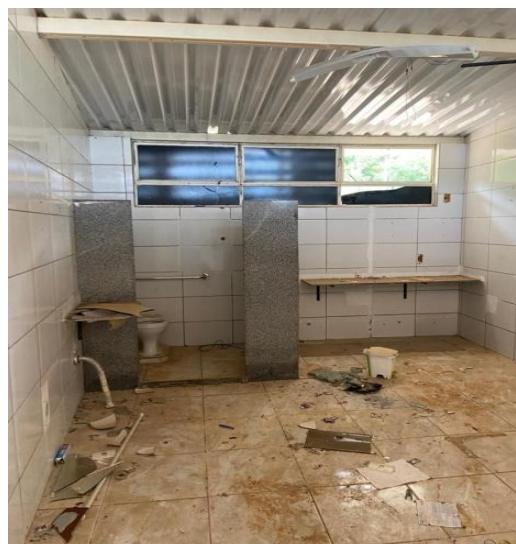
Figura 8 – Interior da edificação