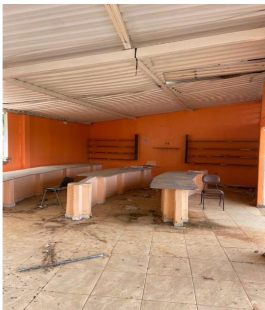
Figura 6 – Interior da Edificação