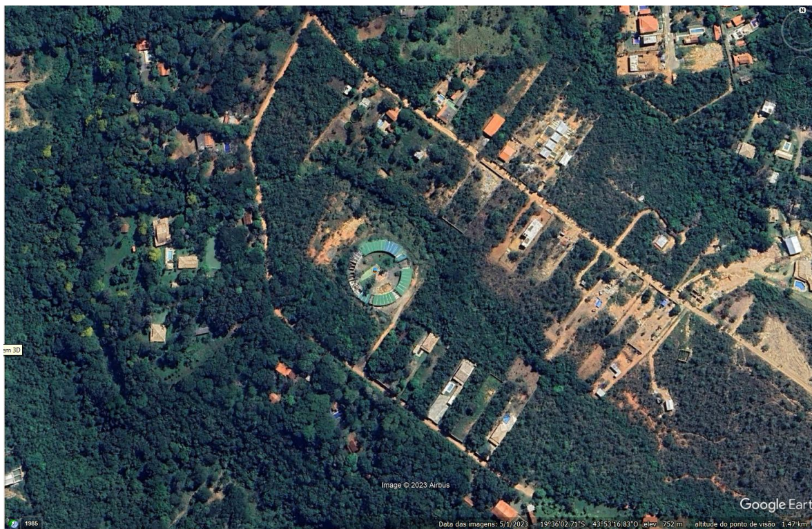
Figura 1- Imagem do Google Maps

OBJETO: REFORMA E AMPLIAÇÃO DO ESPAÇO CÃOVIVER E CIA