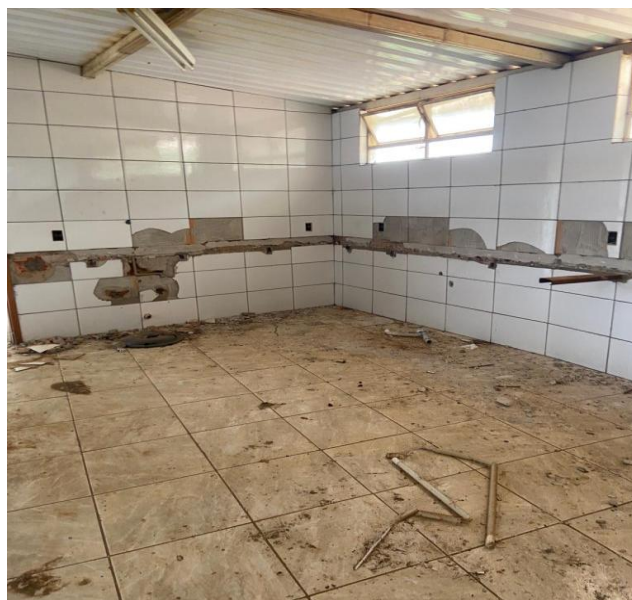
Figura 7 – Interior da Edificação