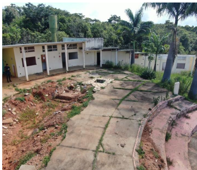
Figura 9 – Exterior