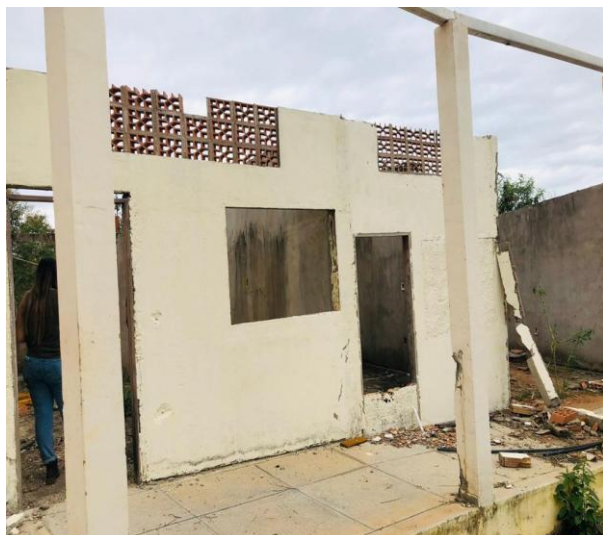
Figura 4 – Edificação – parte sem telhado