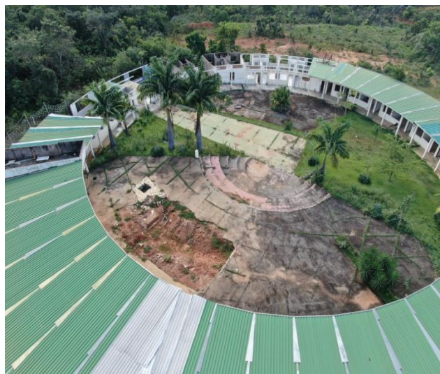
Figura 5 – Vista aérea.