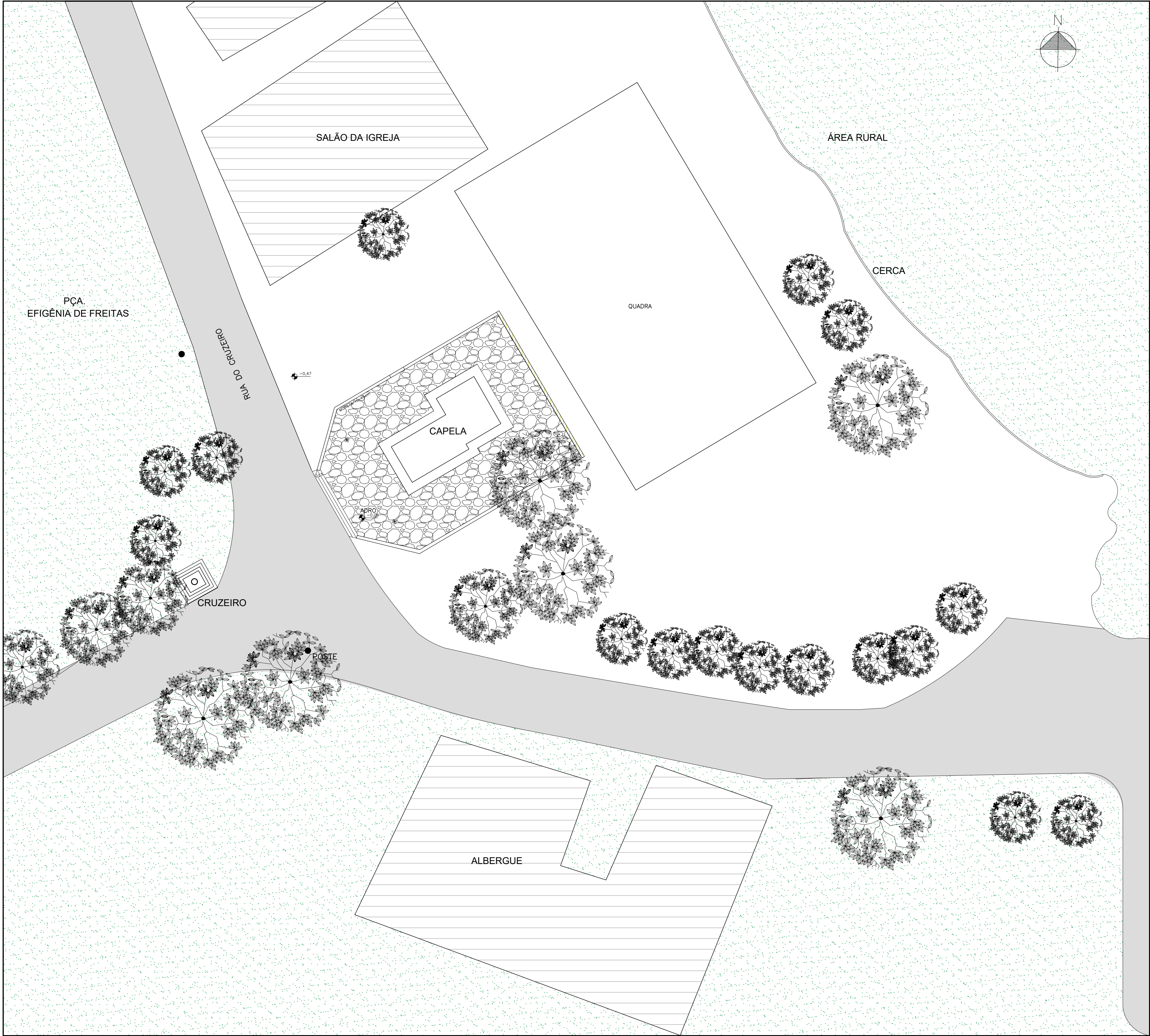
PLANTA DE LOCAÇÃO - AS BUILT