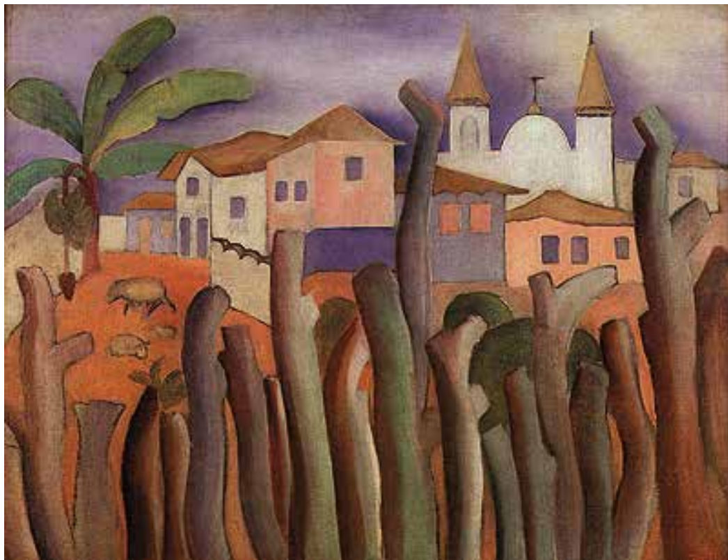
Lagoa Santa, 1925. Tarsila do Amaral. Óleo sobre Tela.

OBSERVAÇÃO: Neste espaço entre ambos os lados do Gramado Gourmet configurado como uma pracinha entre o tablado, a calçada e o gramado para o convívio social dos cidadãos e confraternização dos usuários é um local próximo de onde Tarsila do Amaral pintou a visdta do centro histórico de Lagoa Santa em 1925. Pretendemos no futuro sinalizar tais informações e expor a imagem de sua tela.